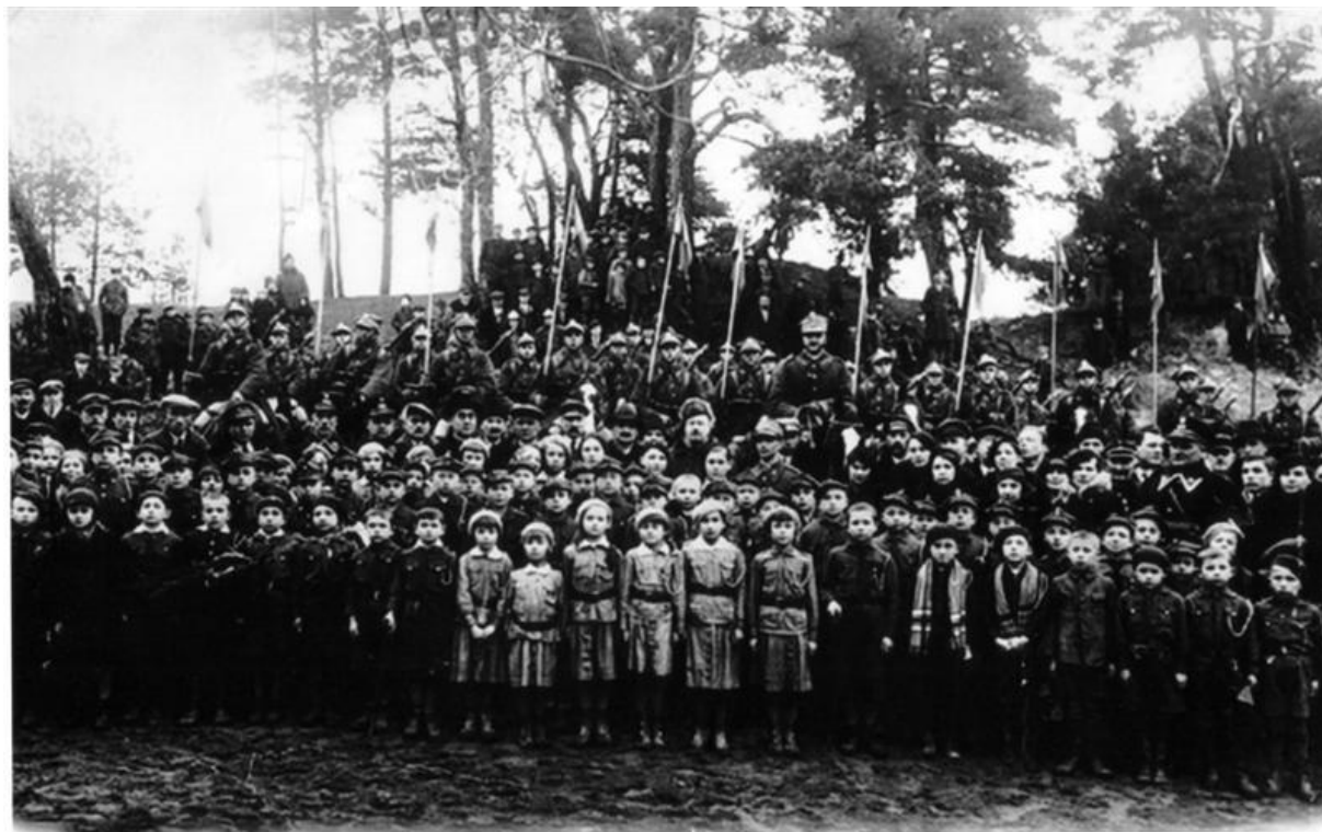
Pamiątka pobrania ziemi 11 listopada 1938r. z pola bitwy w Powstaniu Listopadowym 1831r. w Makówcu Dużym na Kopiec Marszałka Józefa Piłsudskiego

Oto pamiątkowe zdjęcie, które odnaleźliśmy w zasobach Internetu związane z pomnikiem w Makówcu Dużym.