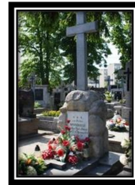
Grób Piotra Wysockiego w Warce

W Warce przeżył prawie 20 lat. Zmarł tam 6 stycznia 1875 r. i został pochowany na miejscowym cmentarzu. Pisma galicyjskie pisały wówczas o nim: „Był to człowiek wysokiej prawości i poświęcenia, dzielny żołnierz, skromny i małomówny”.