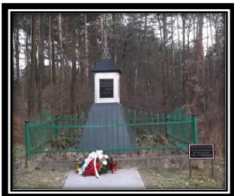
Zbiorowa mogiła powstańców w Makówcu Dużym

Piotr Wysocki walczył w bitwach Powstania Listopadowego pod Dobrem, Wawrem, Grochowem, Okuniewem, Boremlem.